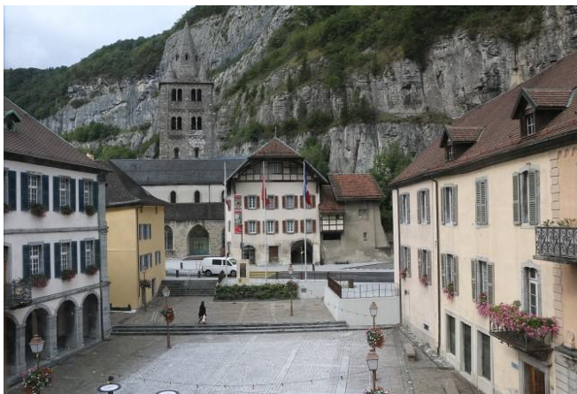
face à l'Abbaye

Un appel de fonds , destiné à consolider l'achat et à aménager ces différents espaces, va être lancé au printemps 2018 . Nous vous remercions par avance de lui réserver un bon accueil.