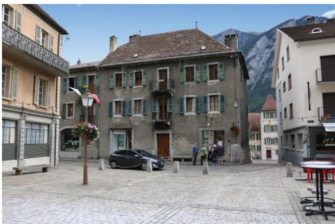
Grand-Rue 74 – 1890 St-Maurice, façade ouest