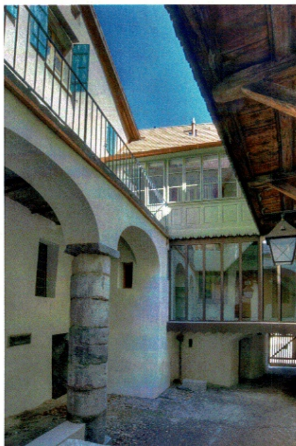
Grand-Rue 74 – 1890 St-Maurice