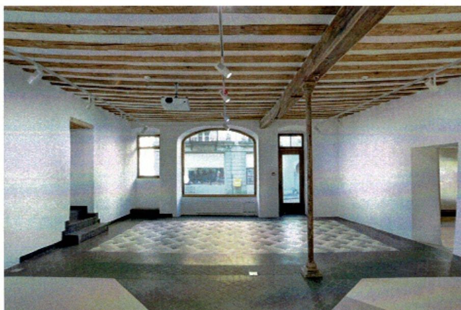
1 ère étape de rénovation 2020