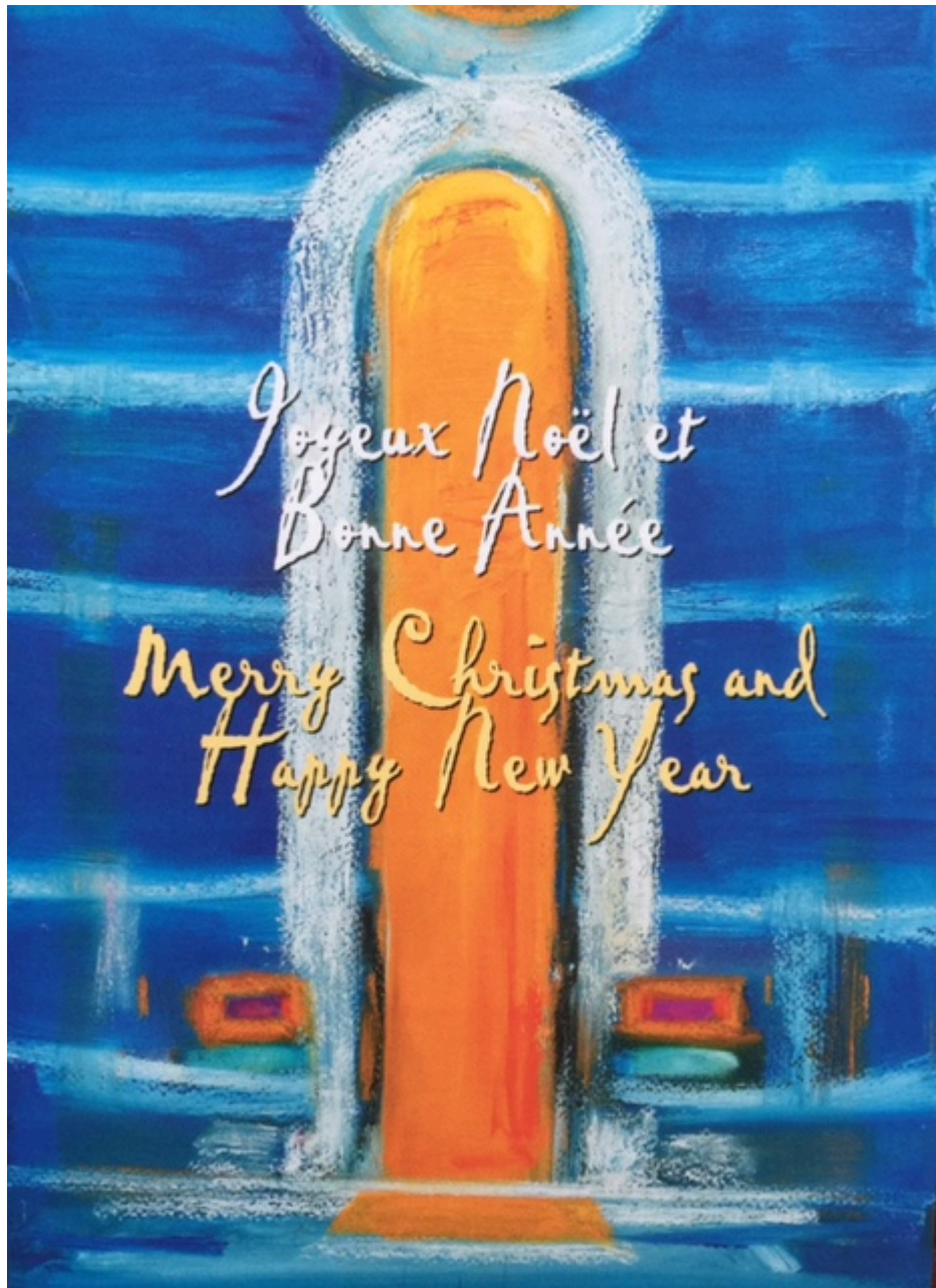
FROSSARD DEROSE Véronik, Porte de temple/Joyeux Noël et bonne année , 15x10.5 cm, 2003, FAA-VFD-2317.