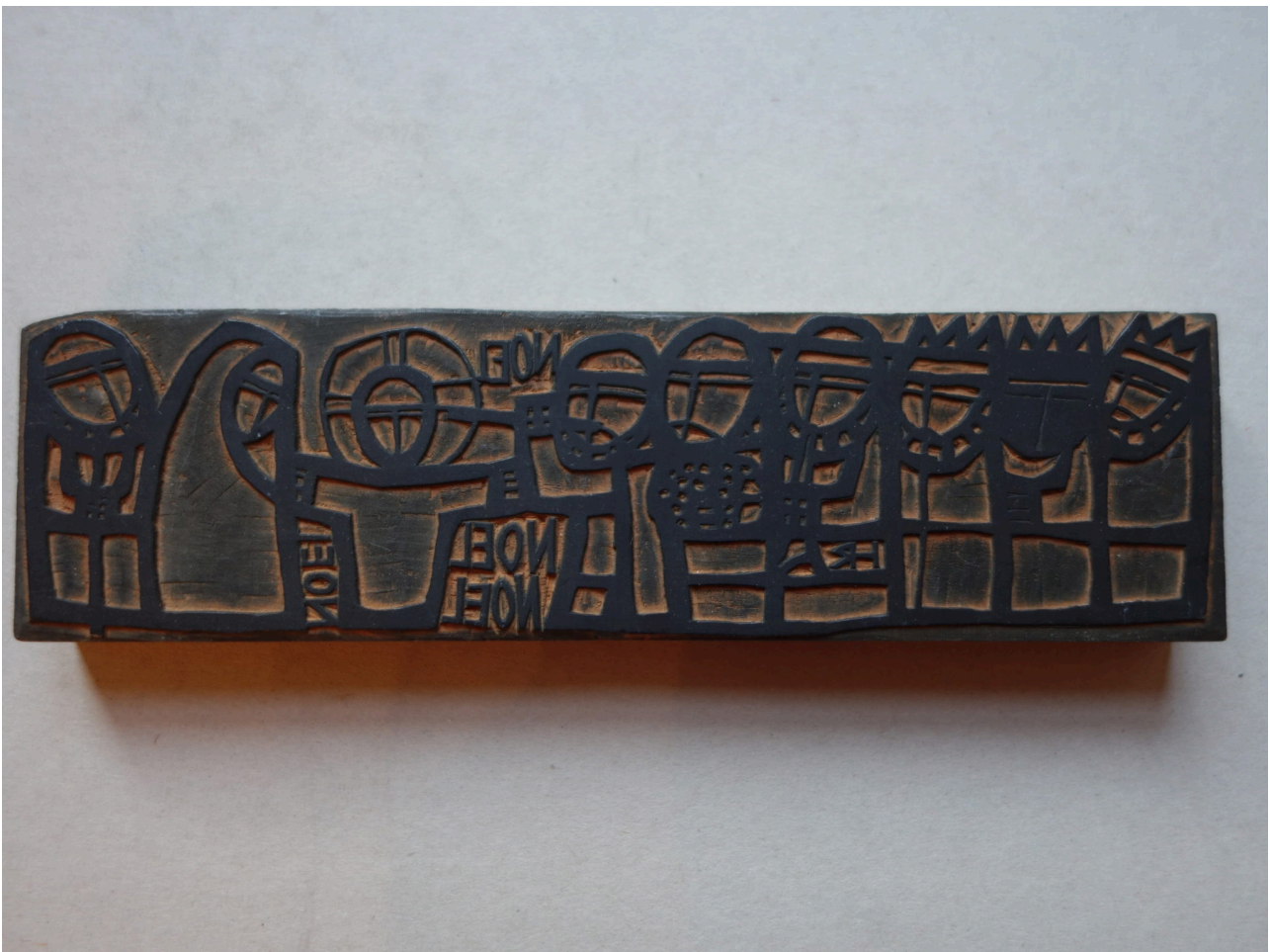
HERITIER Robert, Noël , 6x22x2 cm, matrice, FAA-HER-3085.